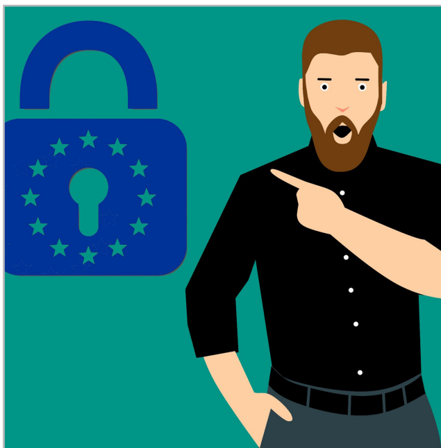
Schon gehört?! Ab dem 25. Mai 2018 tritt die neue EU-Datenschutzgrundverordnung (DSGVO) in Kraft! Sie soll uns alle schützen.

Mit diesen hehren Zielen vor Augen fällt es schon viel leichter, sich auf die zunächst übertrieben wirkenden Vorgaben und Vorschriften einzulassen.