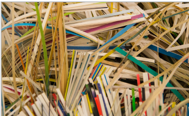
Wichtiger Aspekt der DSGVO: Das „Recht auf Vergessenwerden“. Hierzu gehört die Pflicht für Verantwortliche, nicht mehr benötigte Daten zu löschen bzw. zu vernichten.

Daneben gilt der Grundsatz der Speicherbegrenzung , d.h. Daten müssen frühestmöglich nach dem Wegfall des Zwecks gelöscht bzw. gesperrt werden. Ist also die Notwendigkeit der Verarbeitung zur Zweckerreichung entfallen oder hat die betroffene Person ihre Einwilligung widerrufen und es besteht auch keine sonstige Rechtsgrundlage, sind die betreffenden Daten zu löschen. Die Löschpflicht stellt das sogenannte „Recht auf Vergessenwerden“ der Betroffenen sicher.